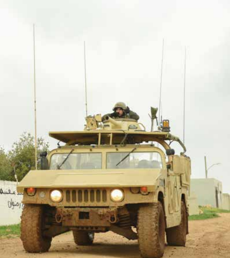
מלחמת לבנון השנייה חשפה שורה של ליקויים במערך המילואים, שהדגישו את חוסר

העם במילואים מלהתקיים בפועל, וגם מוכנותו של זה הייתה נמוכה מן הדרוש.